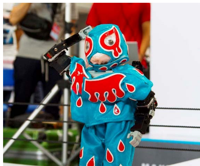
两次大会中登场的流血假面给在中国的表演增添了不少欢乐。

机器人摔跤表演「能行不!」，今后也会在日本以外的各国家和地区进行演出，让全世界的孩子们从机器人表演中获得知识和乐趣，是我们最大的心愿和目标。