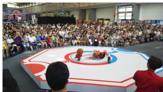
西安国际创客嘉年华的最后一场演出，在会场的中心舞台进行。近千名观众在周围观战